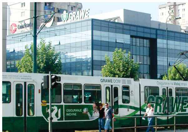
Direkcija GRAWE osiguranja u Sarajevu, BiH